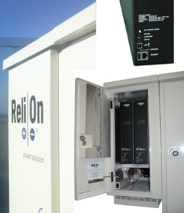
400Wシステム (E-200™ 2セット)