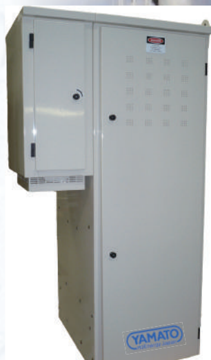
E-200™システムキャビネット 水素供給装置付